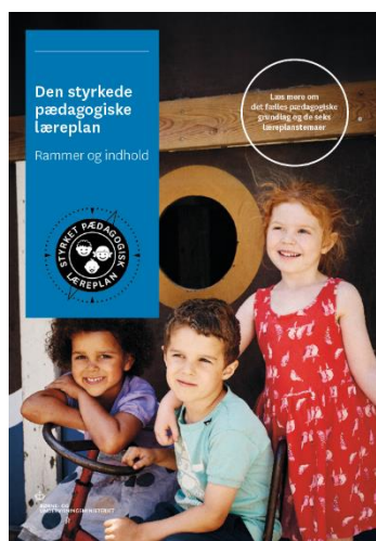
Den styrkede pædagogiske læreplan, Rammer og indhold

Inden for de krav, der følger af dagtilbudsloven, er det op til jer at beslutte, hvordan I konkret vil arbejde med den pædagogiske læreplan. Jeres læreplan skal være et dynamisk og meningsfuldt dokument, som peger fremad, og som I kan bruge aktivt i den løbende udvikling af den pædagogiske kvalitet og jeres pædagogiske praksis.